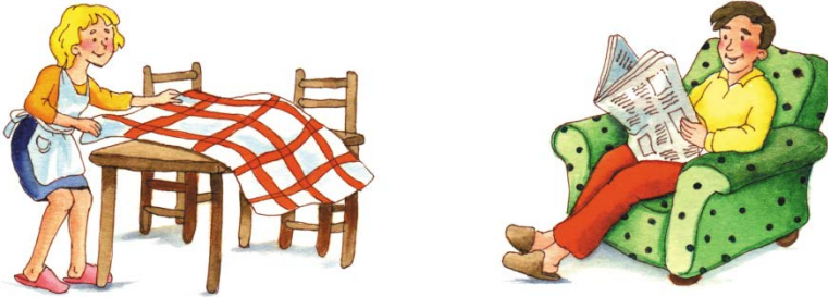
Immagine 1 – Libri per bambini

Secondo te quali sono le caratteristiche che in questa immagine sono attribuite a un uomo e una donna?