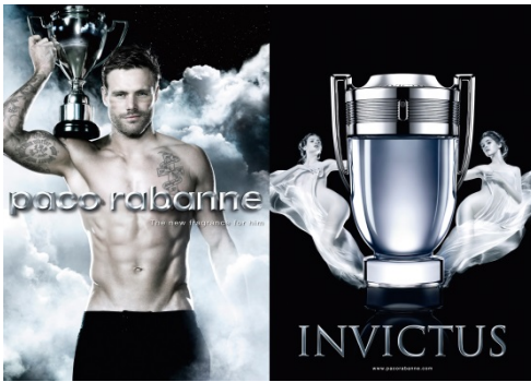
Immagine 4 pubblicità profumo da uomo

Secondo te quali sono le aspirazioni che in questa immagine sono attribuite a un uomo?