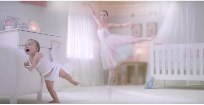
Immagine 3 – pubblicità dei pannolini

Secondo te quali sono le aspirazioni che in questa immagine sono attribuite a una neonata?