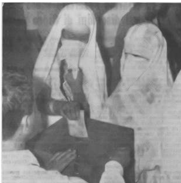
Algerine velate ma ... col diritto di voto

L'iniziativa dei movimenti politici giovanili ticinesi